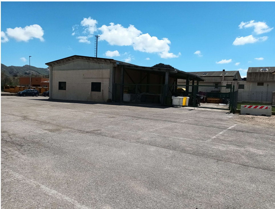
foto 2 zona per il rimessaggio di mezzi ed attrezzature nel Comune di Ovindoli – solo parte retrostante il garage comunale - I mezzi della raccolta trovano prevalentemente ricovero in un'area privata ubicata nel comune di Rocca di Mezzo nella fraz. di Rovere.