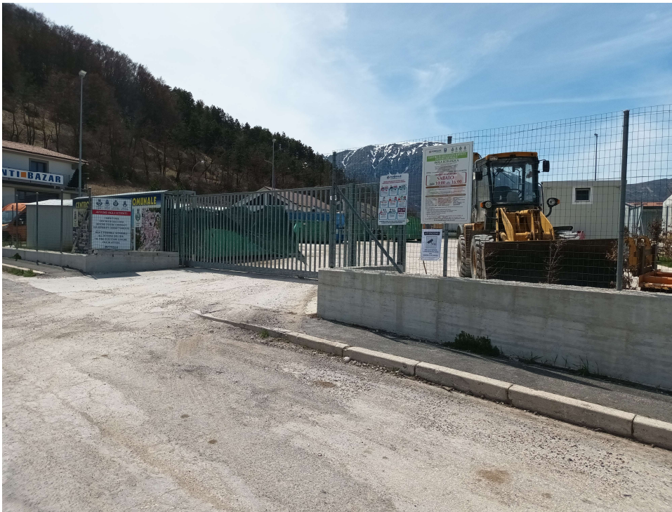
foto 1 centro di raccolta nel comune di Rocca di Mezzo